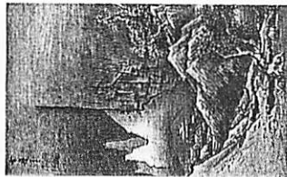
<C>雪舟の『秋冬山水図』(左)と夏珪の『溪山清遠図』(右)