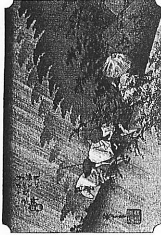
<D>安藤広重の『東海道五十三次』(左)とゴッホの『タンギー爺さん』(右)